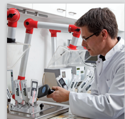
IJK- en reparatieservice zie www.gullimex.com/ijkservice

NL Postbus 114 7620 AC Borne 074 - 265 77 88 info@gullimex.com www.gullimex.com