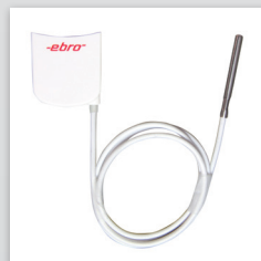
Externe voeler TPX 220 bij EBI 310 voor kernmetingen