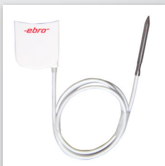
Externe voeler TPC 300 bij EBI 300 voor kernmetingen