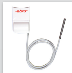
Externe voeler TPX 250 bij EBI 310 voor kernmetingen